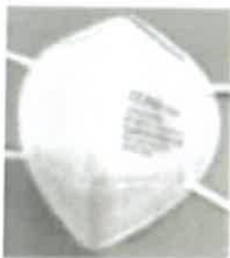
Immagine del prodotto:

Tipo/Classe: FFP2 NR Modello/REF: TF-9006 Numero di serie: 2163-PPE-674